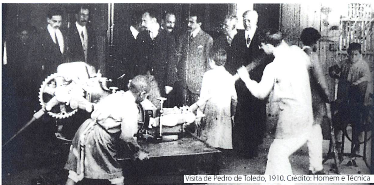
Visita de Pedro de Toledo, 1910.