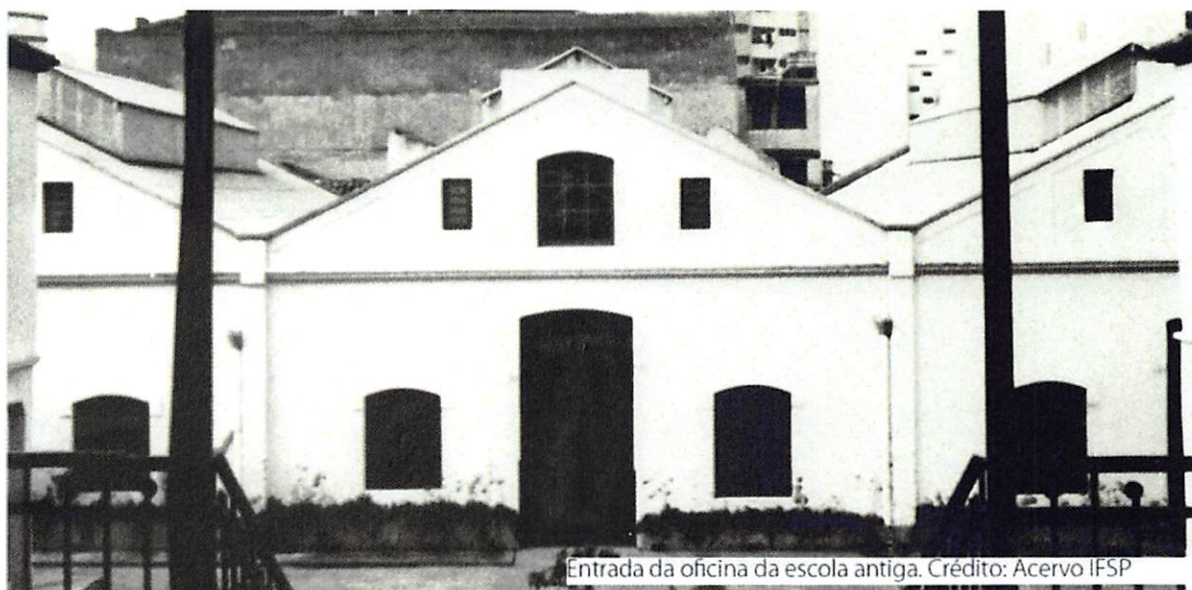
Entrada da oficina da escola antiga.