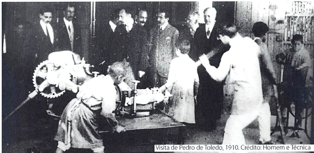
Visita de Pedro de Toledo, 1910.