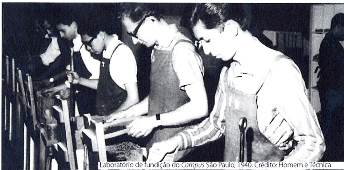
Laboratório de fundição do Campus São Paulo, 1940.