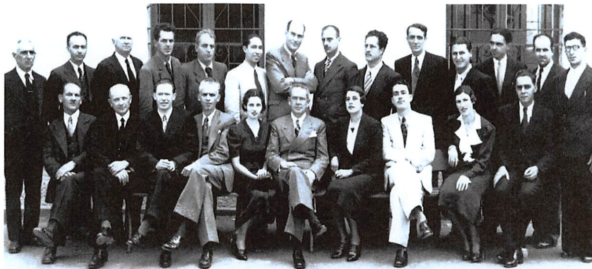
Corpo docente da Escola em 1945.

REDE FEDERAL DE EDUCAÇÃO PROFISSIONAL E TECNOLÓGICA