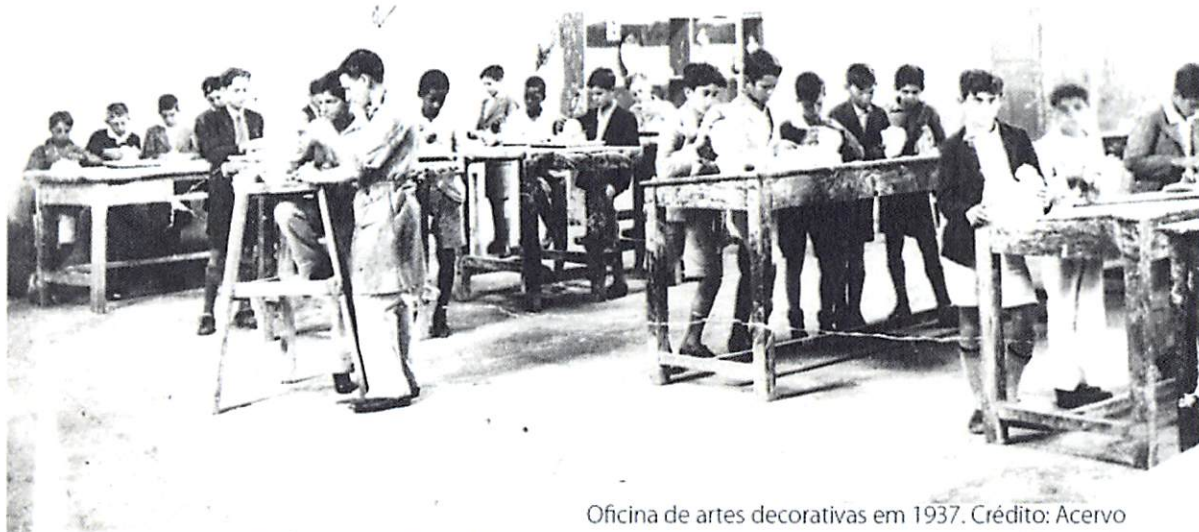
Oficina de artes decorativas em 1937.