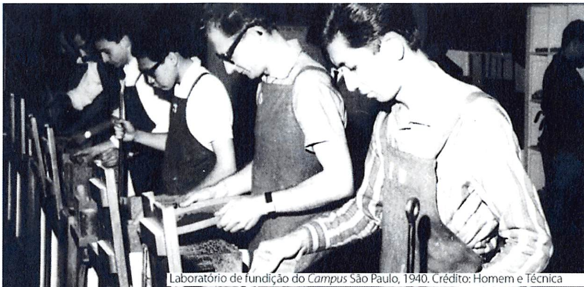
Laboratório de fundição do Campus São Paulo, 1940.