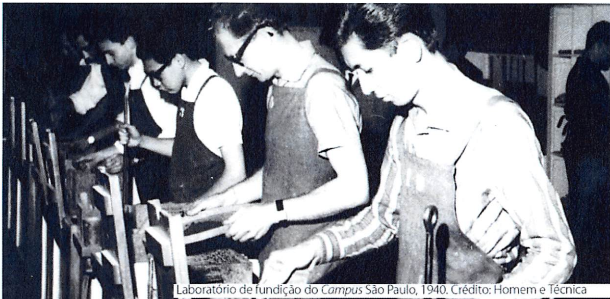
Laboratório de fundição do Campus São Paulo, 1940.