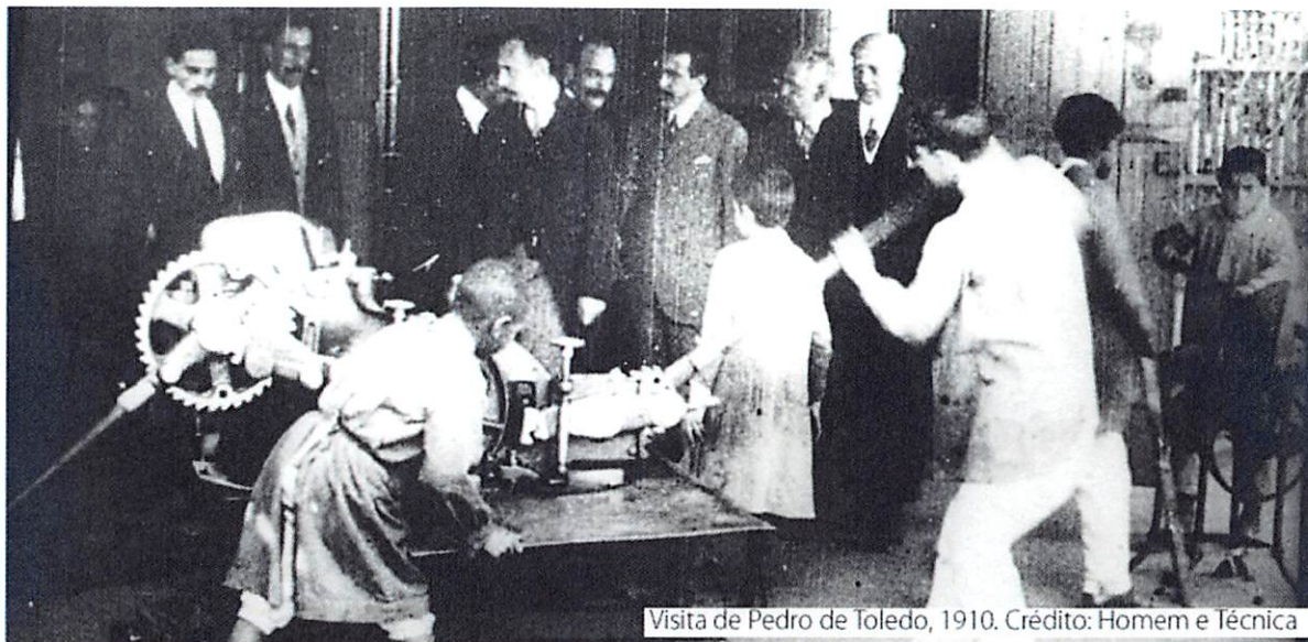
Visita de Pedro de Toledo, 1910.