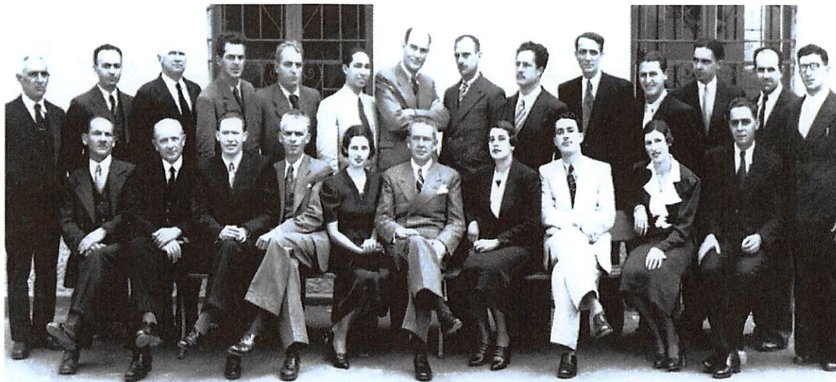
Corpo docente da Escola em 1945.