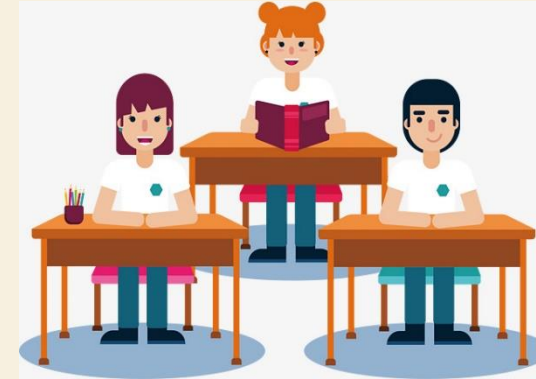
Discentes dos Cursos Superiores